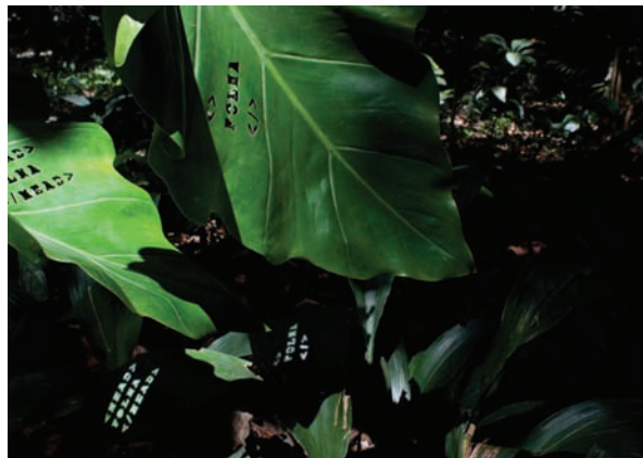
Enrique Radigales. Folha , 2009. Fotografía, 84 x 118 cm

La naturaleza sirve como excusa para enlazar la obra de estos cuatro artistas, donde cada uno aporta un punto de vista diferente acerca de la extrañeza con la cual nos relacionamos en ocasiones con ella. Desde la contemplación de la naturaleza como espectáculo, pasando por las naturalezas virtuales y digitales, las selvas empleadas como campos de batalla o el llegar a analizar el uso doméstico de la misma, suponen un recorrido por cuatro percepciones acerca de esa gran masa que nos rodea y que en el fondo no deja de ser nuestro hábitat natural, si bien en ocasiones parecemos no reconocerla como tal.