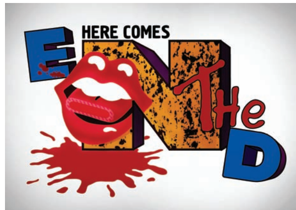
Pablo Pérez Sanmartín. Here Comes The End , 2011 Animación monocanal en bucle (50")

La idea de la exposición consiste en transformar el espacio galerístico en otro menos encorsetado, con un punto relacional y de intercambio de información entre los asistentes a la misma. Tomando el tema/excusa de la música como elemento aglutinador, cada artista seleccionado crea al menos una pieza específica para dicho espacio, convirtiéndolo en un todo como si de una instalación de un sólo artista se tratara aunque cada pieza tenga sentido y autonomía en sí misma.