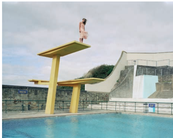
Julia Fullerton-Batten. Diving board , 2004 C-print, 102 x 127 cm y 40 x 50 cm. Ediciones: 5 y 10

Todo cuanto hicimos fue insuficiente es un planteamiento en primera persona del plural —y en pasado— que denota la posibilidad de una emancipación colectiva proyectada a futuro. Los artistas de la propuesta tienen como nexo de unión la construcción de un imaginario muy amplio el que aparecen conectados la tensión entre lo individual y lo colectivo, la idea de masa, el conflicto social y la idea de un sujeto global puesto en duda. Las obras seleccionadas trabajan desde una poética documental a veces llevada al límite de la ficción y muestran la dificultad de construirnos en soledad. Son imágenes en las que hay mucho más de lo que se cuenta.