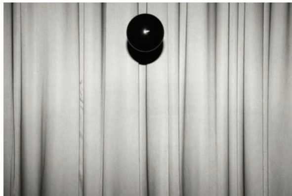
Jacopo Miliani. Every Movement is Different in my Memory , 2010 InkjetFine Art su carta baritata 3 x 60 x 90. Ed. 3 (2/3)

La propuesta gira en torno a dos contextos específicos de representación, escenario y calabozo. En el proyecto se presenta, por primera vez en España, la última producción de Jacopo Miliani [Italia, 1979] y Luc Mattemberger [Reino Unido/Suiza, 1980] con una selección de piezas que incurren en presupuestos estéticos y conceptuales que los artistas vienen desarrollando en su trabajo desde hace tiempo. Ambos están interesados en el proceso cognitivo y por esta razón el planteamiento principal de la propuesta se enmarca en la problemática de traducir la representación simbólica, a través de una construcción que hurta matices y capas, pues en los dos contextos tratados, el símbolo al igual que su presentación como imagen o forma, se encuentra fragmentado o disfrazado.