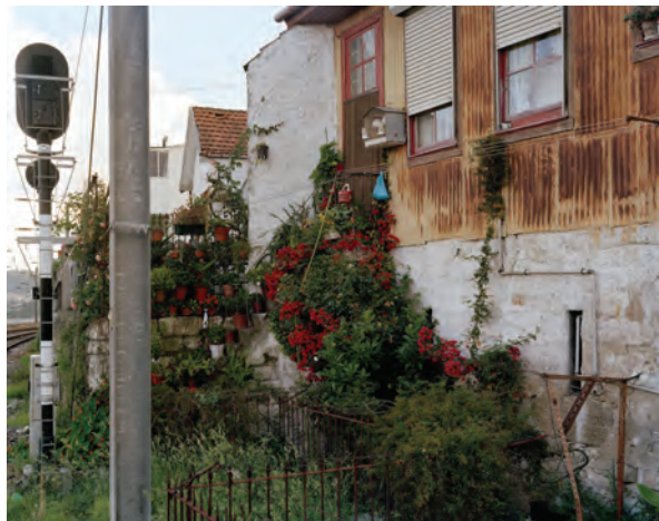
André Cepeda. Untitled, Porto , 2008 Ink jet print, 126 x 160 cm

El discurso de la muestra se articula en torno a la recuperación y transformación de los documentos en monumentos. Los artistas utilizan objetos preexistentes, de los que aprovechan las cualidades de su vida anterior, para dotarlos de una nueva naturaleza artística. En todos los trabajos destaca el proceso como condición ineludible en la creación: el tiempo es la herramienta que modela las obras, antes incluso de que sean concebidas como tales.