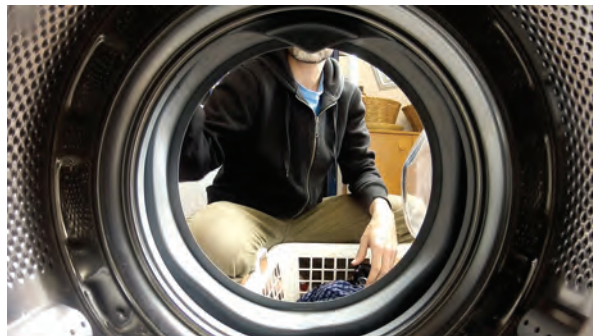
Pedro Guimarães. Wash and Rinse , 2012 Video DVD PAL 16:9 stereo. Duración: 6 min (loop).

Androméstico considera la posibilidad de que las ideas de identidad, sexo y género estén alterando el mundo objetual cotidiano, cambiando el uso de los objetos, su adscripción a los individuos o incluso forzando su sustitución por otros. La exposición parte de la pregunta de si existen entornos objetuales u objetos que que podamos describir como mayoritaria o exclusivamente masculinos, o representativos de la masculinidad, frente a otros netamente femeninos; o de si esos entornos se confunden hoy en uno único, común a los dos sexos. El proyecto no está exento de perspectiva histórica e invita también a determinar transversal y tangencialmente cuál es el estatus del bodegón como género y práctica artística dentro de la contemporaneidad.