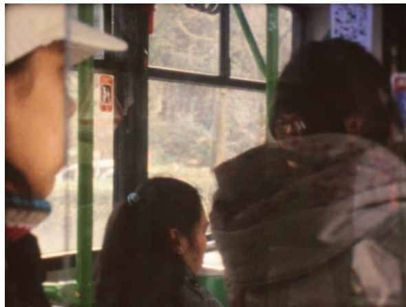
Gintaras Didžiapetris. A Byzantine Place , 2011 Proyección 16mm

Gintaras Didžiapetris, cuya obra pudimos ver en la pasada Bienal de Venecia —ILLUMInations, 54th International Art Exhibition, comisariada por Bice Curiger—, utiliza diversos soportes artísticos como película, fotografía, dibujo, siempre creando atmósferas site-specifics . Actualmente prepara exposiciones individuales para el Fotomuseum Winterthur (Suiza) y el CAC de Vilnius (Lituania). Este año participa en la 5ª Bienal de Bucarest (Hungría).